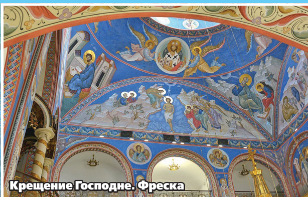
Крещение Господне. Фреска