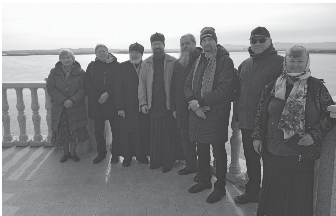
Рисунок 4 – Делегация ОПУ на набережной Амура. Хабаровск