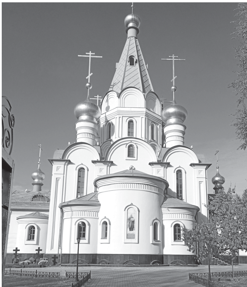
Рисунок 2 – Храм прп. Серафима Саровского в Хабаровске Figure 2 – Church of St. Seraphim of Sarov in Khabarovsk

стым. Если он не укоренен в вере, его знания легко превращаются в инструмент разрушения – не только внешнего, но внутреннего. И наоборот: когда ученый живет церковной жизнью, его дисциплина – химия, юриспруденция, филология, экономическая теория – перестает быть только профессией и становится формой служения.