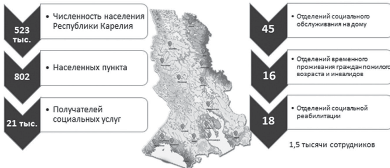
Рисунок 1 – Деятельность Центра по обслуживанию населения Figure 1 – Activities of the Public Service Center