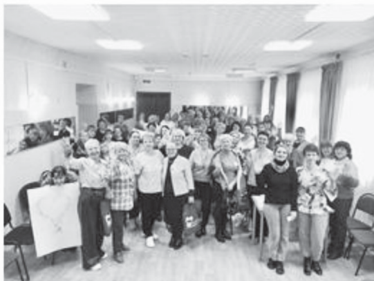
Методическое объединение специалистов и руководителей подразделений ГБУ СО «КЦСОН», г. Сортавала