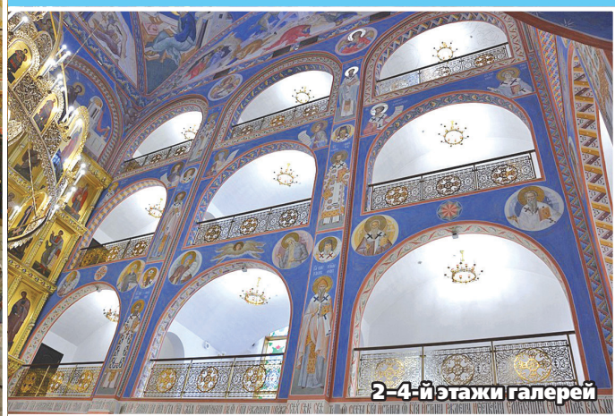
2-4-й этажи галерей