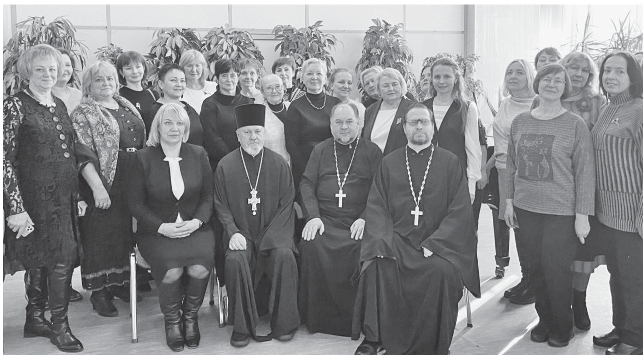
Рисунок 1 – Участники VI Региональной научно-практической конференции «Духовное возрождение как ценностный ориентир проекта «Серебряный возраст»