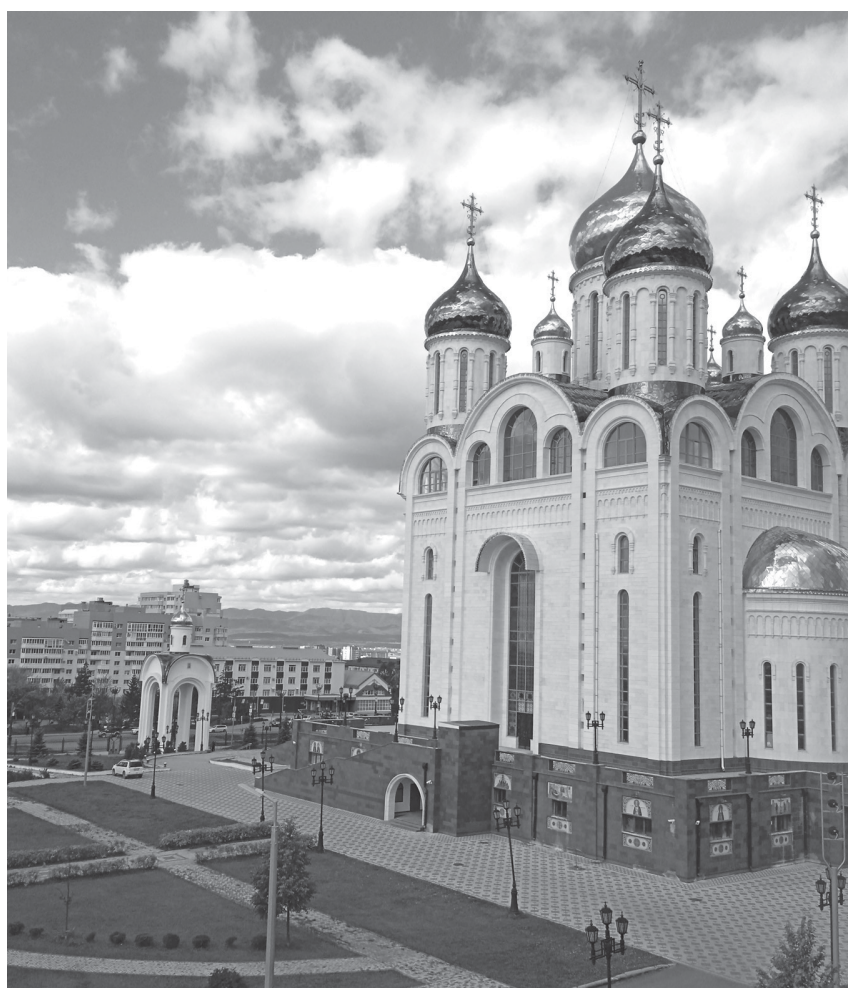
Рисунок 1 – Храм Рождества Христова в Южно-Сахалинске Figure 1 – Church of the Nativity of Christ in Yuzhno-Sakhalinsk

Принципиальная новизна миссии ОПУ заключается еще и в том, что она не ограничивается ролью «ассоциации по интересам» и не подменяет живую