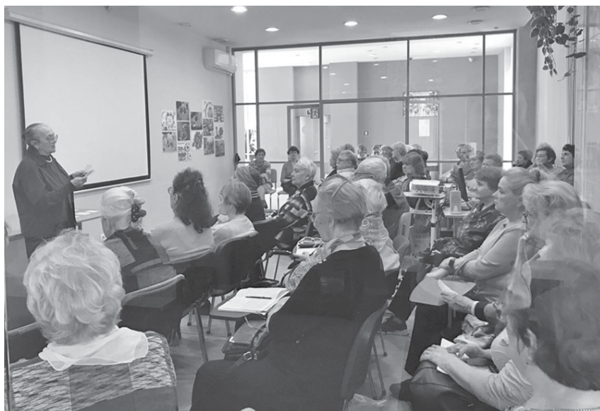
Рисунок 2 – Проведение занятий на тему «Основы православной веры и культуры»

Таким образом, не исключено, что программа «Духовное воз-