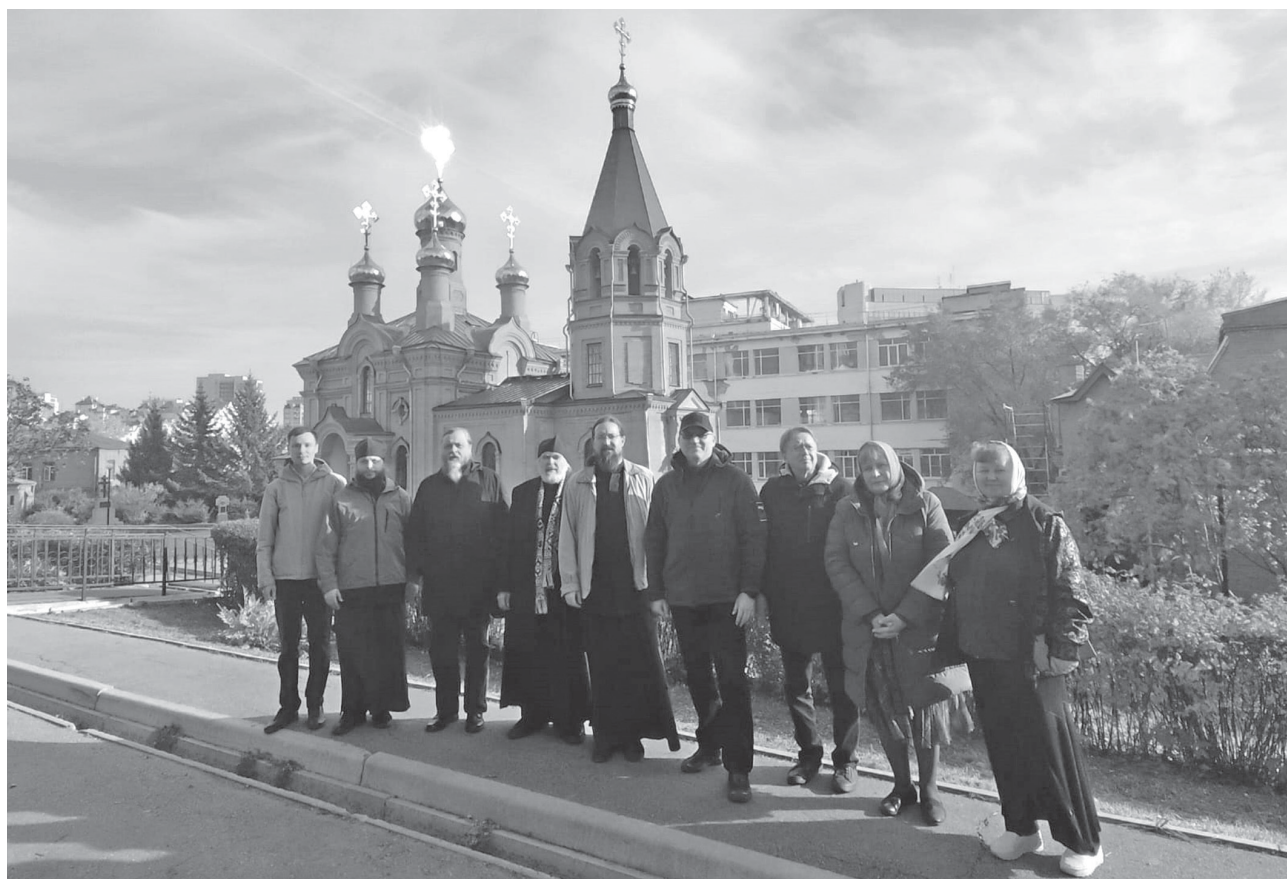
Рисунок 3 – На фоне храма во имя Святителя Иннокентия Иркутского Figure 3 – In the background, the Church of St. Innocent of Irkutsk

При этом мы не должны забывать уроки недавнего прошлого: для коммунистической