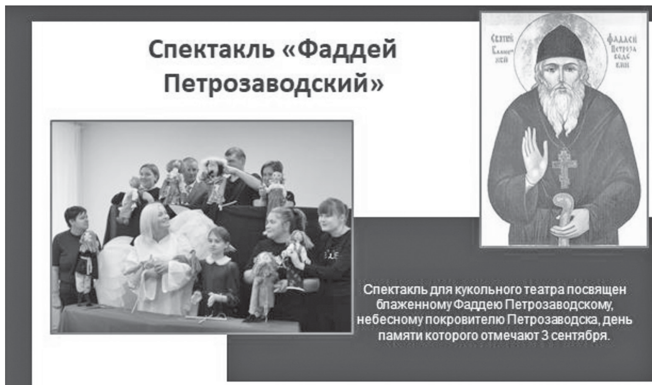
Рисунок 2 – Кукольный спектакль о небесном покровителе Фаддее Петрозаводском Figure 2 – A puppet show about the patron saint Thaddeus of Petrozavodsk

В рамках сотрудничества специалисты вместе со священнослужителями провели мастер-классы, беседы о православии, экскурсии в храмы Петрозаводска и Олонца, организовали паломничество по святым местам Карелии. При этом отмечалась большая заинтересованность всех участников проекта в мероприятиях, направленных на приобщение к православным духовным ценностям.